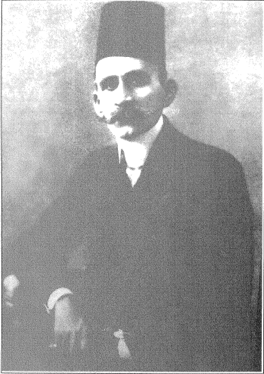
الأمير حسين كمال غضب الشعب لقبوله الحكم بأمر الإنجليز وجرت محاولتان لاغتيا له